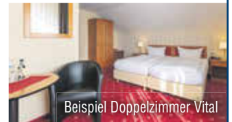
Beispiel Doppelzimmer Vital