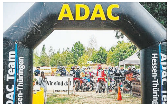
Der Vorstand des MSC- Gräfentonna e.V. im ADAC

Wir hoffen auf regen Zuschaueransturm, viele freiwillige Streckenposten und freuen uns Euch auf dem Gelände des MSC-Gräfentonna e.V. im ADAC begrüßen zu dürfen.