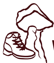
Ausblick Gelersteine-Tour

Tourist-Info-Zentrum Pfälzerwald Schuhmeile 1 · 76846 Hauenstein · Tel. 06392 9233380 www.urlaubsregion-hauenstein.de