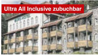
Ultra All Inclusive zubuchbar