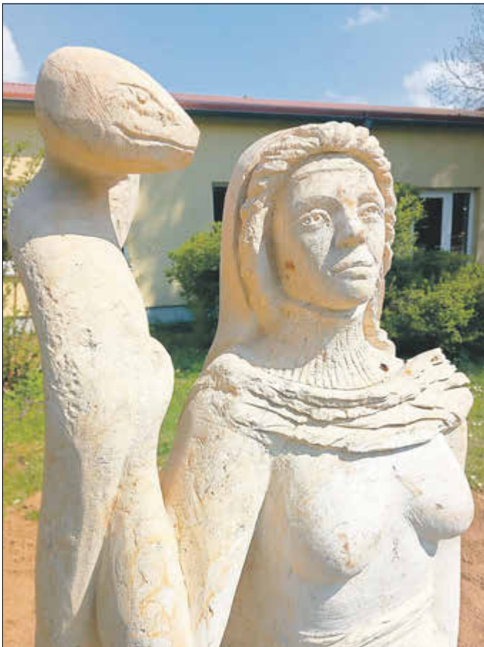
Botschafterskulptur „Kundalini“ am neuen Standort im Schlosspark Weberstedt Weitere Fragen beantworten wir gerne unter: