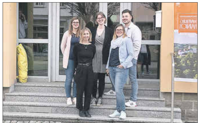
Mitarbeiter:innen vor der Geschäftsstelle zur Einweihungsfeier