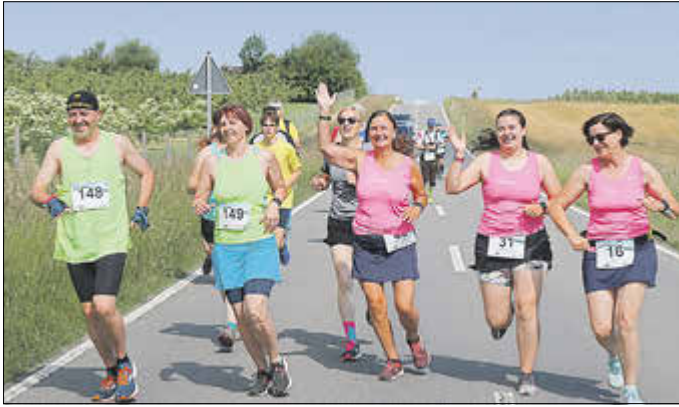
Die Röblingläuferinnen aus Mühlhausen zählen zu den Stammgästen beim Kirschlauf

Die Organisatoren des Kirschlaufes unterstützen auch in diesem Jahr wieder das Kinderhospiz Tambach-Dietharz und rufen Kirschläufer und Zuschauer zum Spenden auf.