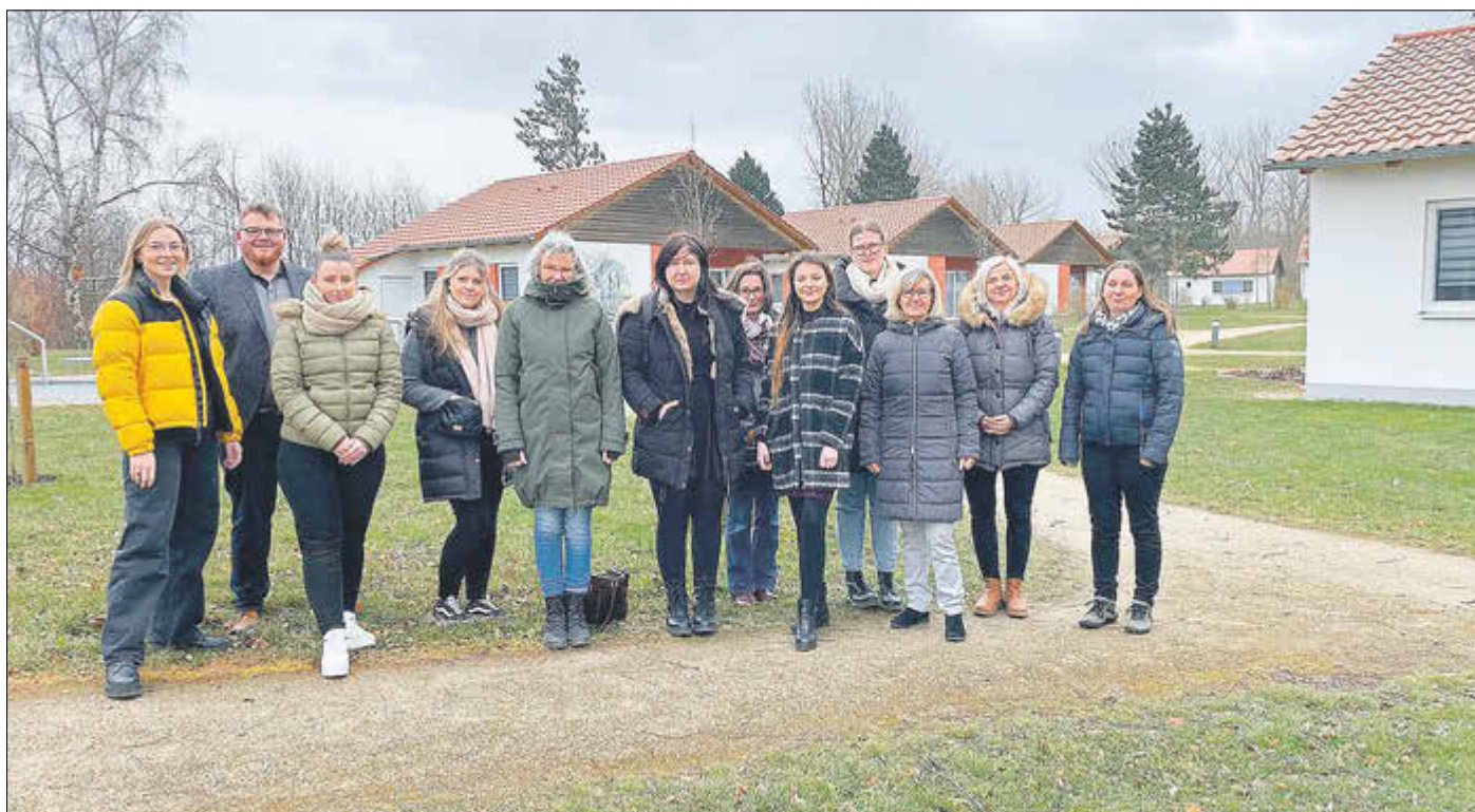
Teilnehmer des zweiten Social-Media-Workshops

Der Welterbergregion Wartburg Hainich e.V. hat für seine Mitglieder eine Workshopreihe entwickelt, bei der sie zum Umgang mit sozialen Medien geschult werden können.